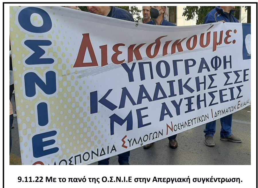
9.11.22 Με το πανό της Ο.Σ.Ν.Ι.Ε στην Απεργιακή συγκέντρωση.

Η Διοίκηση της Ο.Σ.Ν.Ι.Ε. χαιρετίζει τους εργαζόμενους του Κλάδου που απέργησαν, ξεπερνώντας τις δυσκολίες και τα εμπόδια. Χαιρετίζουμε τα Πρωτοβάθμια Σωματεία που με μεγάλη προσπάθεια προετοίμασαν και οργάνωσαν την Απεργία στους χώρους δουλειάς.